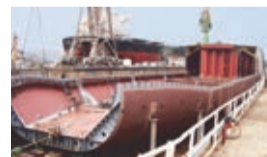
造船 株式会社新笠户Dockyard

作为一座制造业之城，下松市制造各种各样的东西，从与运输业相关的新干线和船舶等，到与最先进的IT业相关的高科技，范围甚广。