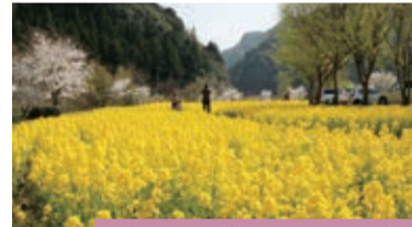
【油菜花】3月中旬起 【樱花】4月上旬起