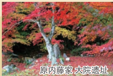
原内藤家 大院遗址