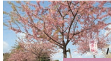
【河津樱花】2月下旬起