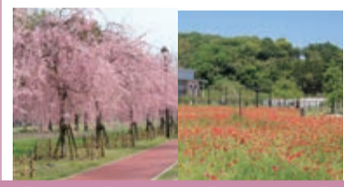
【垂枝樱花】4月上旬起 【墨樱花】5月上旬起 【大波斯菊】9月下旬起