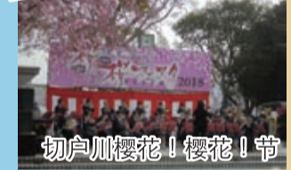
切户川樱花！樱花！节