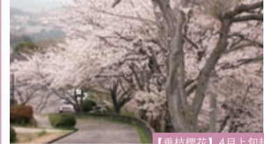
【垂枝樱花】4月上旬起