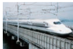
新干线 株式会社日立制作所