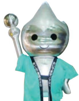
利用薄金属板锤打技术制造出来的铝制“Choruru”株式会社山下工业所制造