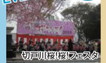
切戸川桜花フェスタ