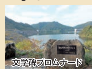
文学碑プロムナード